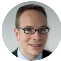
MMAG. ALBERT DORNINGER Austroplant Arzneimittel GmbH / Dr Peithner KG